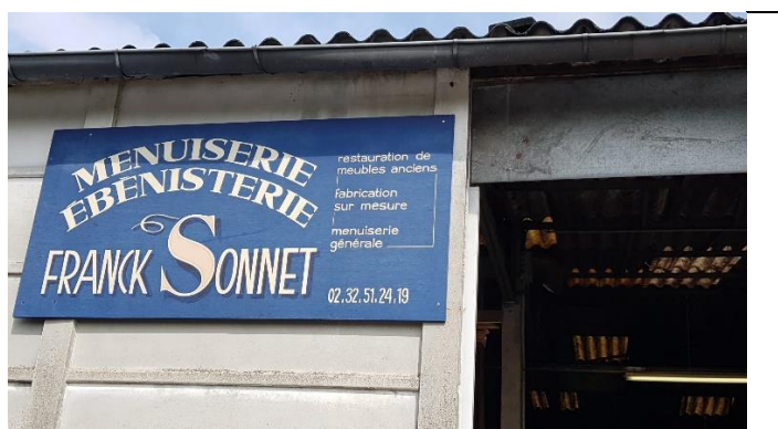
Toutes les étapes de la fabrication sont effectuées par des artisans locaux (ici la menuiserie). #NOUform