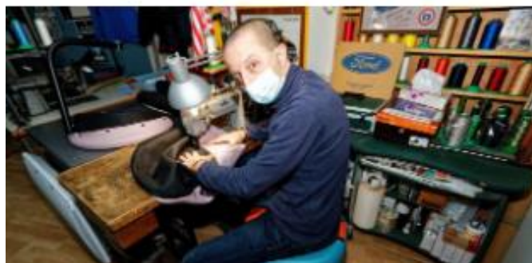
Toutes les étapes de la fabrication sont effectuées par des artisans locaux (ici la sellerie). #PRESSE30